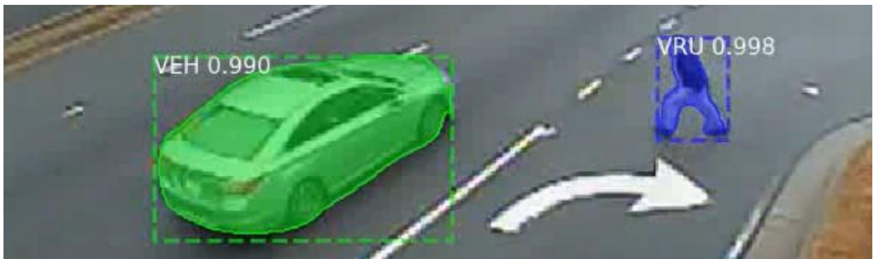
Outil d'analyse vidéo automatisée de Miovision pouvant recenser les accidents évités de peu en vue d'aider les villes à passer à la prévention en sécurité routière.

Les systèmes de sécurité intégrés font en sorte que les villes s'intéressent de plus en plus aux données portant sur les accidents évités de peu pour veiller de manière préventive à la sécurité routière. On s'éloigne du modèle réactif utilisant les données sur les collisions, une approche qui ne révèle pas les facteurs de risque lorsqu'un problème crée un « accident en devenir ». Les données sur les accidents évités de peu, elles, permettent de prédire où risquent de se produire les prochains accidents.