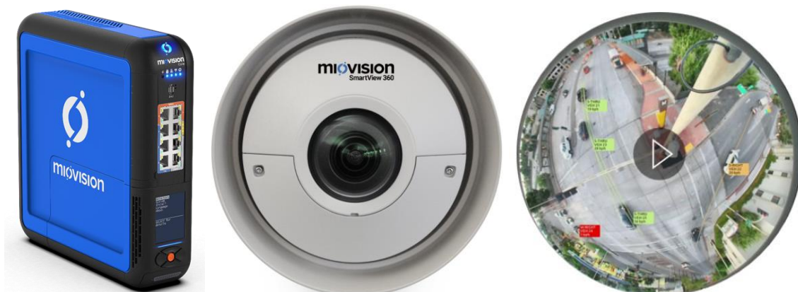
Figure 2 □ Module Miovision CORE DCM avec système de caméras SmartView 360